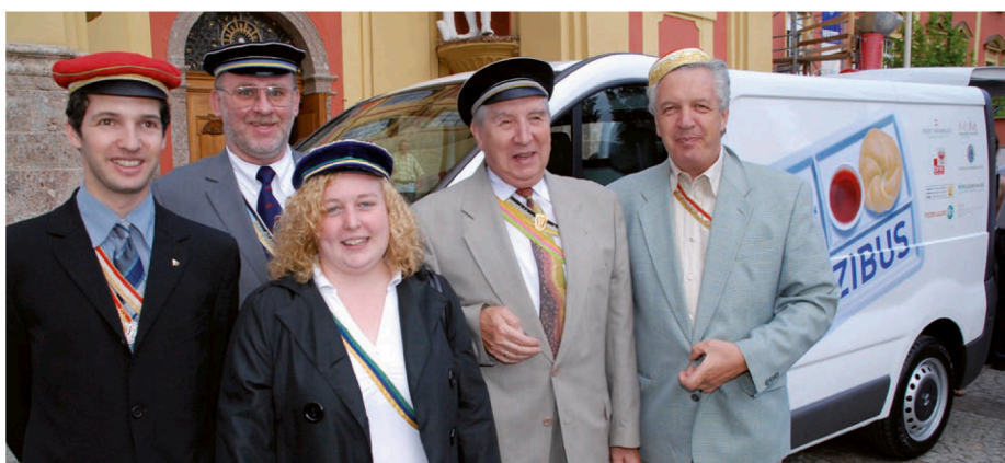
Die Vinzenzgemeinschaft Tiroler Mittelschulverbindungen (unterstützt durch die Mädchenverbindung Veldidena) übernimmt die Ausfahrt jeden Freitag, die Vinzenzgemeinschaften der Hochschulverbindungen Leopoldina und RaetoBavaria die Ausfahrten am Mittwoch bzw. Montag.